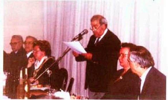
ДГ Сотос Сотириу поздравява ротарианците и гостите на срещата

Съвременният глобален икономически ред се създава от прекалено тясна прослойка. Той влошава хроничното неравенство в разпределението на богатствата, предизвиквайки големи финансови рискове, създавайки много „вратички“, за да може капиталът да избегне социалните и екологични отговорности, и отслабвайки силата на пазара чрез процеси на свръхконцентрация. Той е заплаха за ганъчната база на все повече и повече правителства, принуждавайки децата да работят, унифицирайки културния ни живот и в същото време пропускайки да предложат решение за проблема с нарастването на населението или да осигурят световен мир.