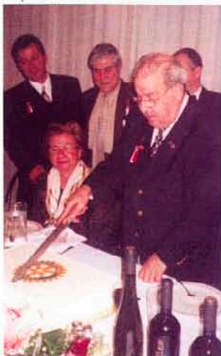
ДГ Сотос Сотирiu разрязва празничната торта