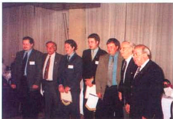
Президентите на РАК - Ямбол, и РАК - Бургас, получиха чартърните грамоти