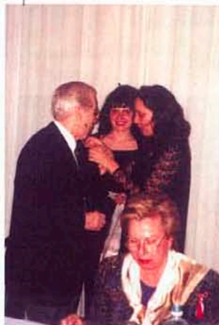
Мартеници за здраве!