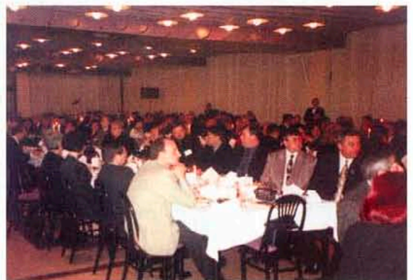
Участниците в срещата