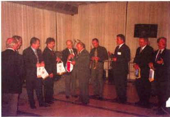
Традиционната размяна на флагове